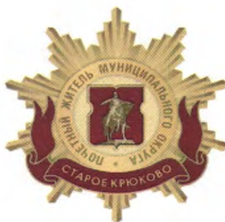
Рисунок нагрудного знака к званию «Почетный житель внутригородского муниципального образования – муниципального округа Старое Крюково в городе Москве»

Приложение 3 к решению Совета депутатов внутригородского муниципального образования – муниципального округа Старое Крюково в городе Москве от 18 февраля 2025 года № 35/07